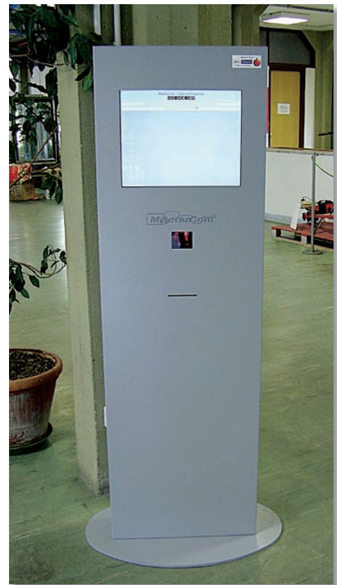
Sistema di rilevazione ingressi-uscite-ritardi alunni dell'ITIS.

Interazione in tempo reale tra scuola e famiglia