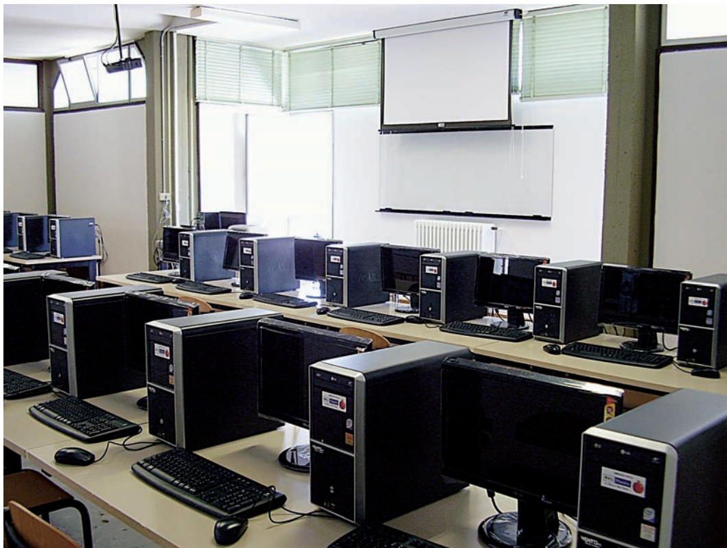
Il nuovo laboratorio informatico dell'ITIS.